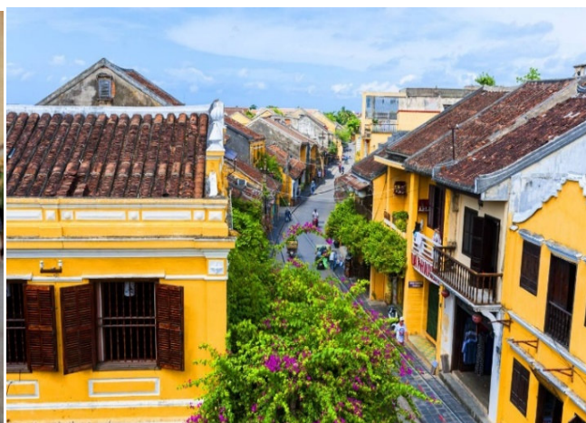
ホイアンの黄色い家屋と壁

当資料は、情報提供を目的として、キャピタル アセットマネジメント株式会社（CAM）が作成したもので、投資信託や個別銘柄の売買を推奨・勧誘するものではありません。当資料は CAM が信頼性が高いと判断した情報等に基づき作成しておりますが、その正確性・完全性を保証するものではありません。当資料に記載されている特定の企業名や商品名等は当資料の理解を深めていただくために紹介したもので、個別の銘柄の推奨を目的とするものではなく、CAM の運用ファンドにその銘柄を組み入れることを保証するものではありません。当資料の内容は作成基準日現在のものであり、将来予告なく変更されることがあります。