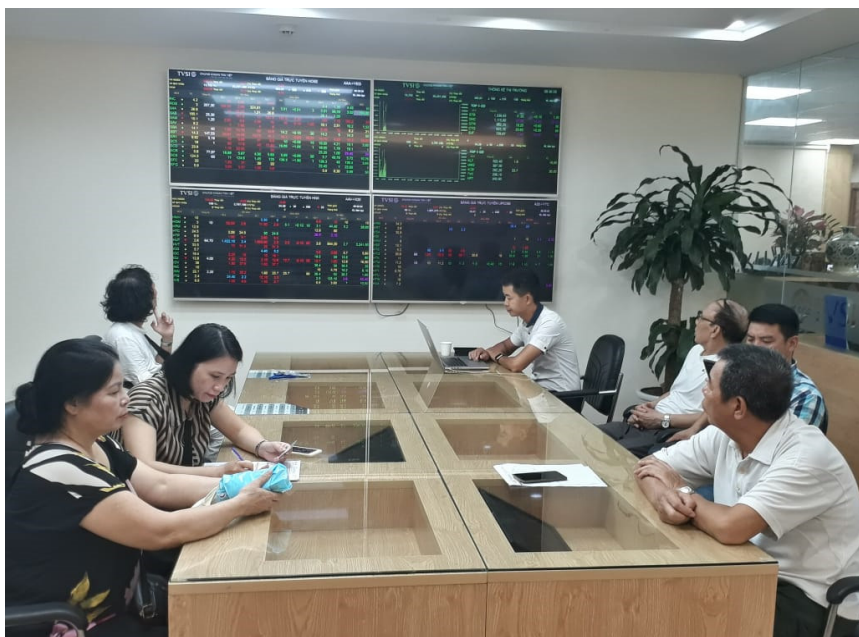
(証券会社に群がる個人投資家)