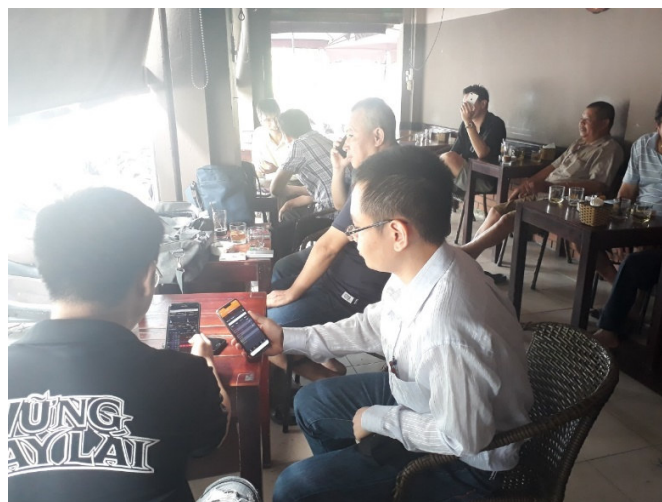
(カフェで株式投資に勤しむ人々)