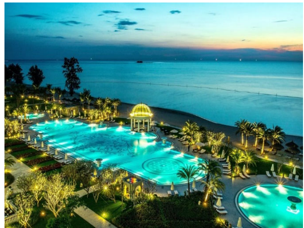
ピンパール・フーコック・リゾート&ゴルフ