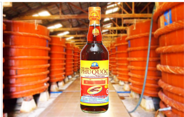
フーコックのヌクナム（魚醤）

当資料は、情報提供を目的として、キャピタル アセットマネジメント株式会社（CAM）が作成したもので、投資信託や個別銘柄の売買を推奨・勧誘するものではありません。また、CAM が運営する投資信託に当銘柄を組み入れることを示唆・保証するものではありません。当資料の内容は作成基準日現在のものであり、将来予告なく変更されることがあります。当資料に市場環境等についてのデータ・分析等が含まれる場合、それらは過去の実績及び将来の予想であり、今後の市場環境等を保証するものではありません。当資料は当社が信頼性が高いと判断した情報等に基づき作成しておりますが、その正確性・完全性を保証するものではありません。