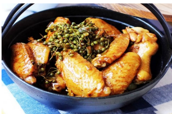
コショウで蒸し鶏

美しい景色に加えて、鯧のサラダ、焼きウニ、ハムニンカニ、コショウで蒸し鶏などのフーコック料理も来訪者には魅力的です。