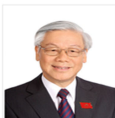
Nguyễn Phú Trọng