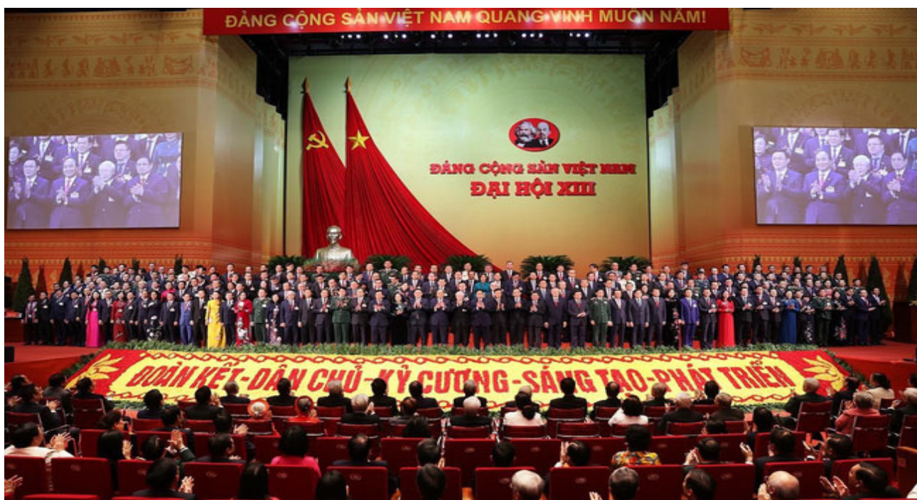
第13期ベトナム共産党全国大会の200名の中央執行委員会

1月26日、全国の党員510万人を代表する1,587人が出席し、第13期ベトナム共産党全国大会がハノイ市国家会議センターで開催されました。大会は2月1日の午前まで行われ、予定よりも1日半早く終了しました。第13期（2021～2026年任期）党中央執行委員会の構成員が投票により決定されました（党中央委員会の180名の公式委員と20名の代替委員を含む200名）。