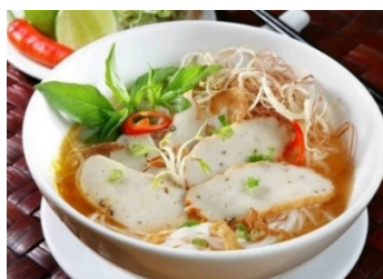
ブンチャーカー (Bun cha ca)