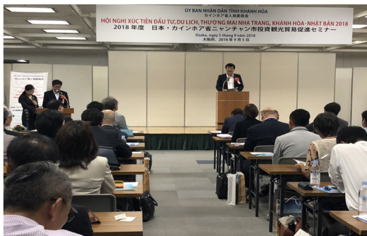
2018年日本・カインホア省ニャチャン市投資観光貿易促進セミナー