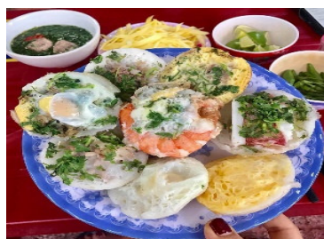
バインカン (Banh Can)

米粉ベースの生地を使い半円状に固めて焼き上げて、具にはエビや豚肉などが添えられる料理