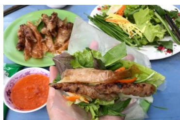
ネムヌン (Nem nuong)

として有名です。また、ネムヌン、ブンチャーカー、バインカンなどの地元料理も来訪者には人気があります。