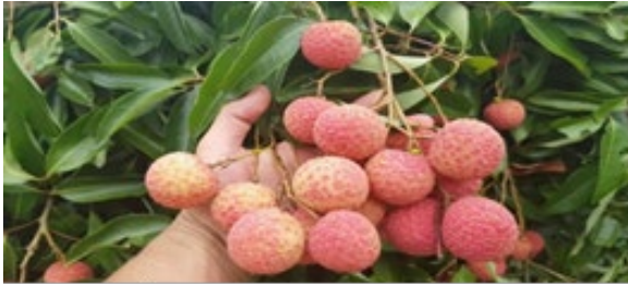
タインハー群のヴァイチェウ