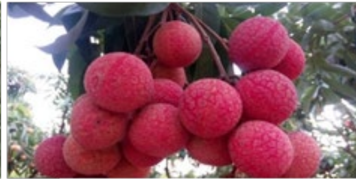
ルックガン群のヴァイチェウ

以前は、ライチの品質は低く販売価格も安く抑えられていました。各農家がそれぞれのやり方でライチを栽培していたからです。しかし、近年、品質向上に向けて輸出基準を満たす生産方法が導入され、ライチの品質・価値は向上しています。その結果、より多くの企業が輸出基準に則った生産プロセスを確立することになり、輸出量は増大しています。現在、ベトナムは国内ライチの総収穫量の50%ほどを約30か国・地域に輸出しています。中国がベトナム産ライチの最大輸出先でライチ総輸出量の約90%を占めていますが、近年、米国、EU、カナダ、オーストラリア、日本など要求の厳しい市場にも進出を果たし、輸出先が拡大しています。ベトナム農業科学研究所によると、ベトナムは世界のライチ生産国20カ国の中で、中国とインドに次ぐ第3位の生産量を誇り、ライチ輸出額では2番目となるシェアを獲得しています。ベトナム産ライチの品質はインドや中国の製品よりもはるかに優れ、世界最高水準にあると言われています。